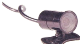
Carmedien CM-MIC 80 Euro

Vertrieb: Carmedien carmedien.com Schulstraße 15, 02953 Bad Muskau