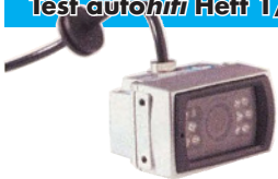
Axion DBC114036 SB 360 Euro

Vertrieb: Axion www.axionag.de Röntgenstraße 4, 89264 Weißenhorn