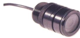
Carmedien STO 45 Euro

Vertrieb: Carmedien carmedien.com Schulstraße 15, 02953 Bad Muskau