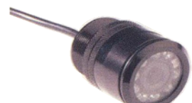
Carmedien STO-IR 50 Euro

Vertrieb: Carmedien carmedien.com Schulstraße 15, 02953 Bad Muskau