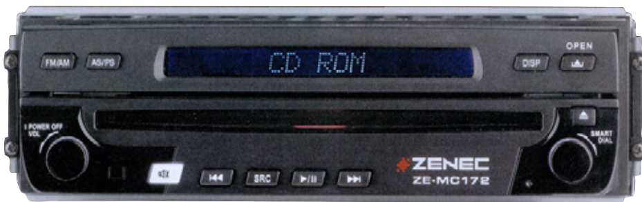
Weißer Tastenbeleuchtung wirkt immer dezent und edel

... und seine visuellen und optischen Qualitäten sind ebenfalls klasse