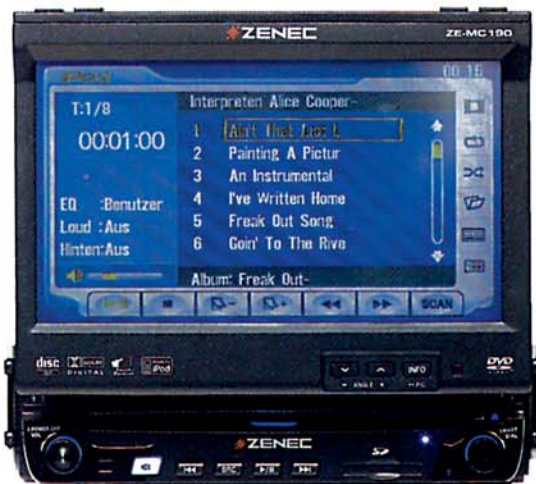
Der Zenec versteht sich ab Werk mit dem Apple iPod