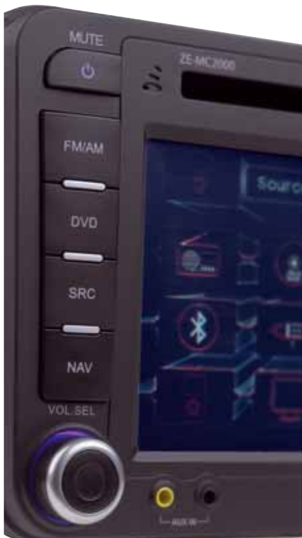
Bis ins Detail: Knöpfe, Beleuchtung und die Gehäusefarbe passen perfekt zur Umgebung