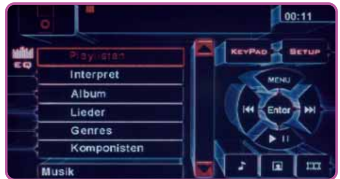
Die Steuerung des iPod ist selbsterklärend und somit komfortabel

der Front des Gerätes und bietet sich so ebenfalls für das schnelle und flexible Wechseln der Speichermedien an. Mal eben die Urlaubsbilder ansehen ist also kein Thema. Am MC2000 ist alles dran. Fertig. Es wird auch immer wieder Leute geben, die noch etwas mehr Klang haben wollen als das, was die internen Endstufen an Originallautsprecher hergeben. Kein Thema, eine komplette Bank Vorverstärkerstufen mit Front-, Rear-, Center, und Subwoofersignal ist fast schon wie selbstverständlich ins Gerät integriert und gibt den Weg frei für externe Endstufen und Nachrüstlautsprecher. Bei all der Vielfalt möchte man natürlich ein Navigationssystem anschließen können. Es ist fast unnötig zu erwähnen, dass es a.) mit dem NA200 eins gibt, erfreulich, dass es b.) Dank iGo8-Software auf dem neuesten Stand ist und c.) für aufgerufene 270 Euro für ein per Touchscreen steuerbares Festeinbaunavi quasi sowieso Pflicht ist.