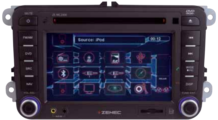
Dank der angepassten Formgebung und Schraublöcher ist die Installation schnell erledigt