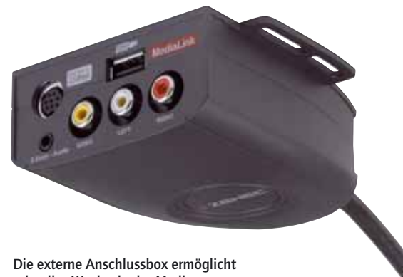
Die externe Anschlussbox ermöglicht schnelles Wechseln der Medien

Wir tippen auf das Bluetooth-Symbol. Nach der unkompliziert vonstatten gehenden Synchronisation mit dem Mobiltelefon finden wir das Telefonbuch, entgangene Anrufe und auch gewählte Rufnummern. Das Handy bleibt selbstverständlich dabei in der Jackentasche, alles geht vom Touchscreen aus. Da wir auch ein paar MP3s auf unserem Mobiltelefon haben probieren wir die Audiostreamingfunktion aus, und auch die funktioniert ohne Probleme. An dieser Stelle möchten wir jedoch darauf hinweisen, dass das nicht mit allen Handys funktioniert. Wer sich nicht sicher ist, ob sein Handy die dafür benötigten Protokolle (A2DP für Audiostreaming und HFP für das Freisprechen) unterstützt, sollte es