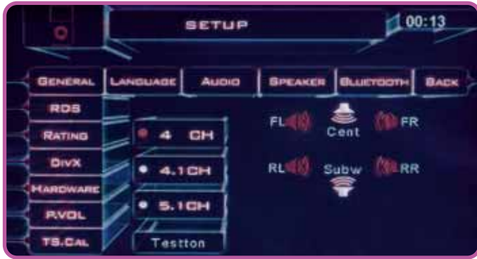
Das komplette Mutlimediapaket mit Surroundsound ist selbstverständlich möglich