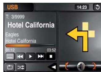
Modalità split-screen: display di navigazione all'interno del menu A/V