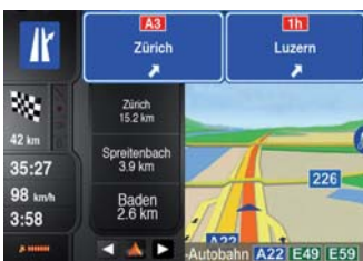
Rendering della segnaletica reale: mostra le indicazioni sulle autostrade in tempo reale