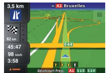
Funzione smart-zoom automatica per ingrandire incroci e corsie di svolta