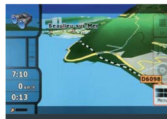
Mappa topografica 3-D