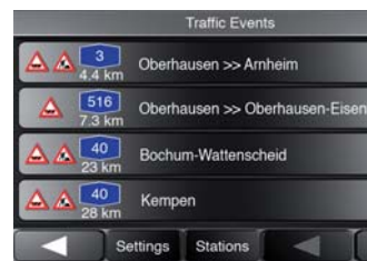
Annunci sul traffico lungo il percorso con TMC