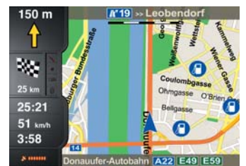
In modalità 2-D la mappa può essere orientata verso nord oppure nella direzione di guida