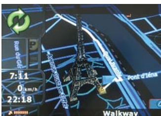
Diverse modalità di colore disponibili; per esempio colori tenui per la modalità notturna

vista a 2-D e 3-D così come una voce guida precisa (in 28 lingue diverse) e un display GUI facilmente comprensibile (anch'esso in 28 lingue) assicurano una navigazione a prova di errore. Lo zoom automatico agli incroci o alle rotonde permette di evitare confusione anche in situazioni complicate. La modalità galleria e l'assistente di percorso più la visualizzazione 3-D dei paesaggi o delle città (con palazzi, punti di interesse e mappe cittadine) semplificano la navigazione così come la modalità split-screen per le autostrade con rendering della segnaletica reale (visualizzazione della segnaletica autostradale sulla mappa).