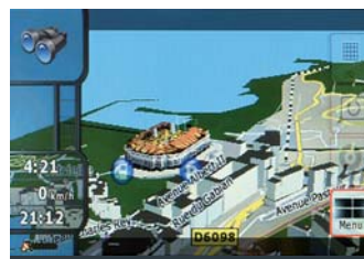
Visualizzazione mappa 3-D di paesaggi e città con palazzi, punti di interesse e mappe