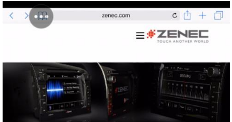
Abbildung 1/- 2 – iPhone original Bildschirm Darstellung/- Vollbilddarstellung wenn unterstützt vom iPhone z.B bei Safari, Spotify, Video-Wiedergabe usw.