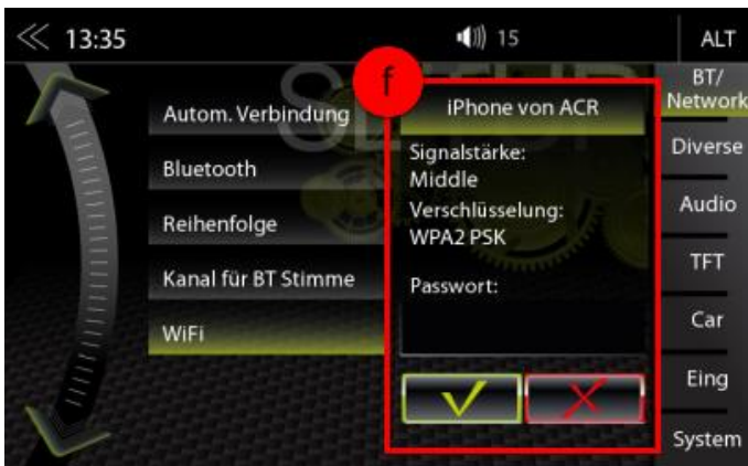
f) Passwort Eingabefeld